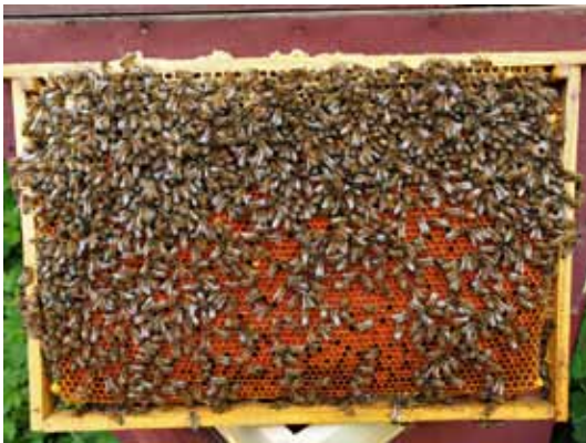
Mesilastega kaetud suurraam.

Kõige määravam on siin aeg, millal võrsikperesid teha, ja mida soovitakse saavutada. Kui lendperede tegemist ja perede poolitamist