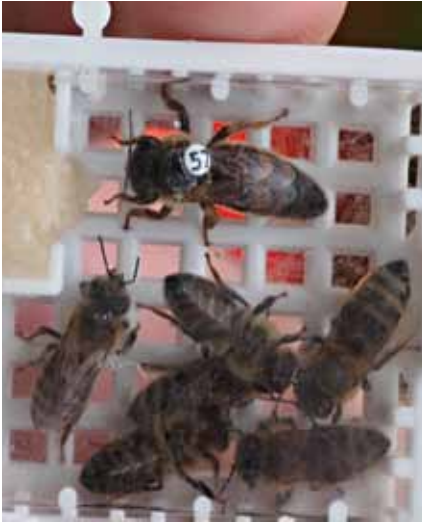
Mesilasema emaanndmispuuris.

kajastub otseselt meesaagis ja pere tugevuses. Seetõttu ei ole sülemid mesila laiendamiseks kõige targem viis, aga kui sülem juba tuleb, on soovitatav see ikkagi kinni püüda ja tarru panna.