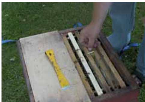
Ema andmine.

Nagu näha, pole mesilaspe- rede tegemine mingi keeruline tegevus, vaid kõigile mesinikele võimetekohane.