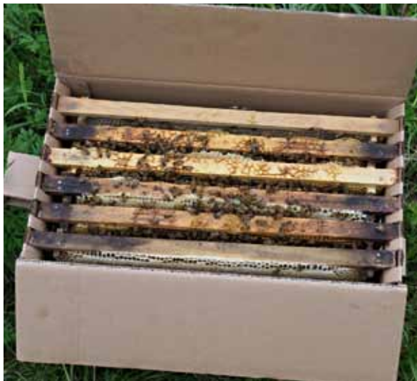
6-raamine pere.

Enamasti mahub 3–4-kilone sülem kenasti ühte korpusesse ära. Tuleb jälgida, et kärjepõhjad oleksid ilusti traatide küljes kinni, muidu võib see mesilaste raskuse all ära vajuda. Korpustaru puhul on kõige mugavam raputada pere kohe korpuse sisse ja panna taru paika. Siis jääb ära sülemikastidega mässamine ja pere teistkordne tarrupanemine.