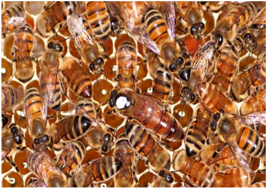
Mesilasema ja töölised meekärjel.