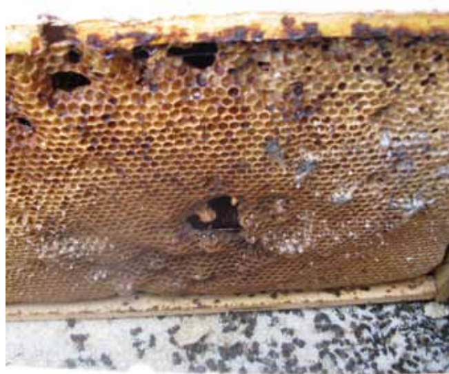
Talvel hukkunud mesilaspere kärj kevadel

Kõlbmatud kärjed sulatatakse kevadel vahaks ka seetõttu, et vältida kärjekoi ründeid ja mesilaste vargustungile õhutamist ning tagada kärjehoidlas hügieen ja puhtus.