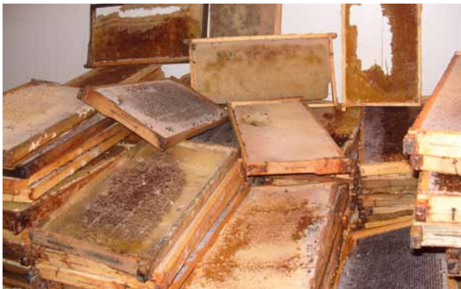
Sulatusse minevad kärjed

takse kevadel, pere esmasel läbivaatamisel, talvitunud raamid ükshaaval, tõmmates viltpliiatsiga raamide pealmise liistu peale kriipsu.