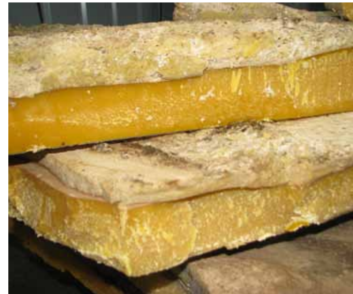
Selitusvannis eraldunud valkjashall ballastaine