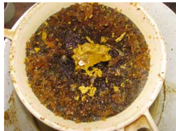
Suure meesisaldusega kärjest saadud vaha