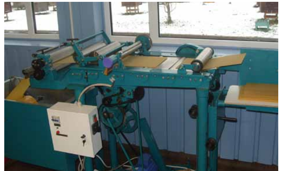
Gravüürvaltsimise masin koos kärjepõhja formaadi lõikusega