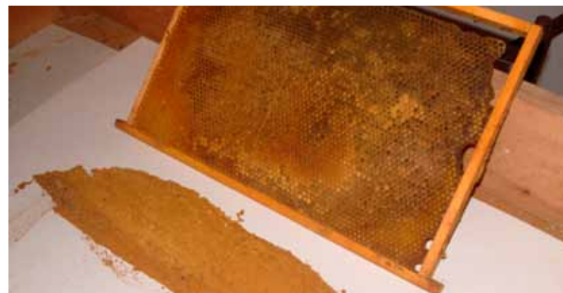
Suiralesta poolt hävitatud suir

Lestade elutegevust soodustab niiskus ja soojus 25-30 °C.