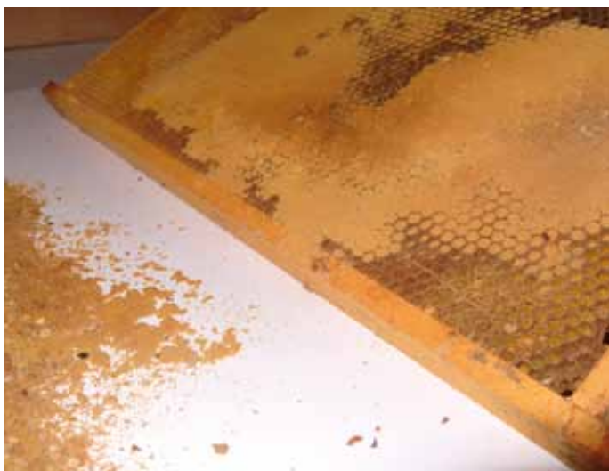
Suiralesta poolt pulbriks muudetud suur imab sulatamise käigus vaha endasse

Vaha eraldumine on pärsitud ka suirakoi ja kärjekoi kahjustatud kärgedest.