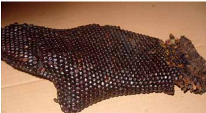
Nukukestad pärast vaha sulatamist

Tumedamatest ja mitmeid aastaid seisnud kärgedest ning suirarohkusega kärgedest tuleb vaha vähem välja. Vaha imbub paksukihiliste nukukestade sisse või sidustub suiraosakestega.