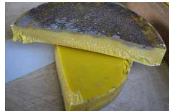
Murdekoht vahakettas näitab jääkainete sisaldust