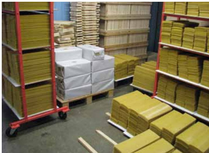
Kärjepõhjade kuivatamine enne pakendamist

Gravüürvaltsid pressivad lindile sisse kärjekannupõhja struktuuri läbimõõduga 5,4 mm, seejärel lõigatakse lint vastavalt raamimõõdule. Kuna kogu tööprotsess toimub veekeskonnas, kuivatatakse valmis kärjepõhjad enne pakkimist kuivatusriiulitel.