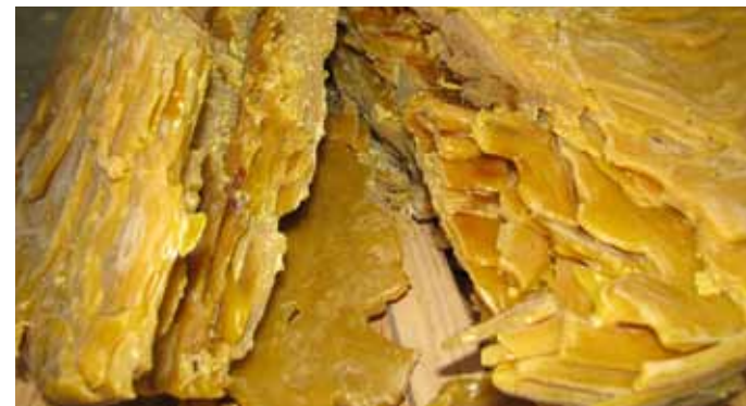
Esmasel kärgede sulatamisel saadud kihiline vaha

Auruga sulatamisel saadud vaha sulatatakse uuesti.