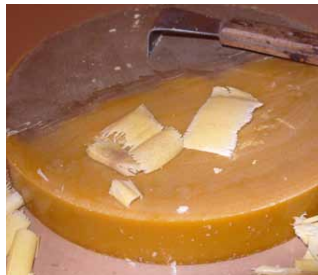
Vahakettalt settekihi eemaldamine

Vaha esmase kõitlemise all mõeldakse toiminguid, mille käigus sulatatakse mesilaste poolt ülesehitatud kärjed ja meekaanetis, lisaehtised jm. tarust ja inventarilt pärit vaha sisaldavad kraapmed. Nii saadakse vedel vaha, mis toatemperatuuril kiiresti hangub. See vaha sulatatakse uuesti ja lastakse hanguda ning saadakse vahaketas, mille alumiselt küljelt eemaldatakse settekiht.