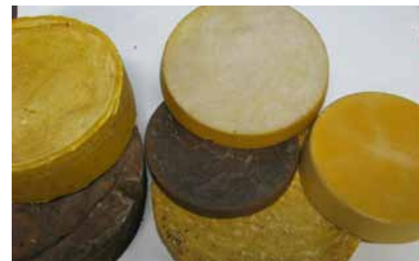
Tumedatel vahakestastel on ümbersulatamise käigus toimunud mee ja suira kõrbemine, mis on muutnud vahakettad tumedaks

Kärgedest sulatatud vaha on reeglina tumedam kui kaanetisest sulatatud vaha. Selle otseseks põhjuseks on kärgede sulatamisega kaasnev peenfraktsioon, mis koosneb suira, taruvaigu ja nukukestade väikeosadest ning mõjutab vaha värvi. Mitmekordsel sulatamisel moodustab peenfraktsioon settekihi, mis kipub ümbersulatamise käigus kõrbema. Kui kärjeraame on desinfitseeritud gaasipõleti või leeklambiga, satuvad vaha sisse tahmaosakesed.