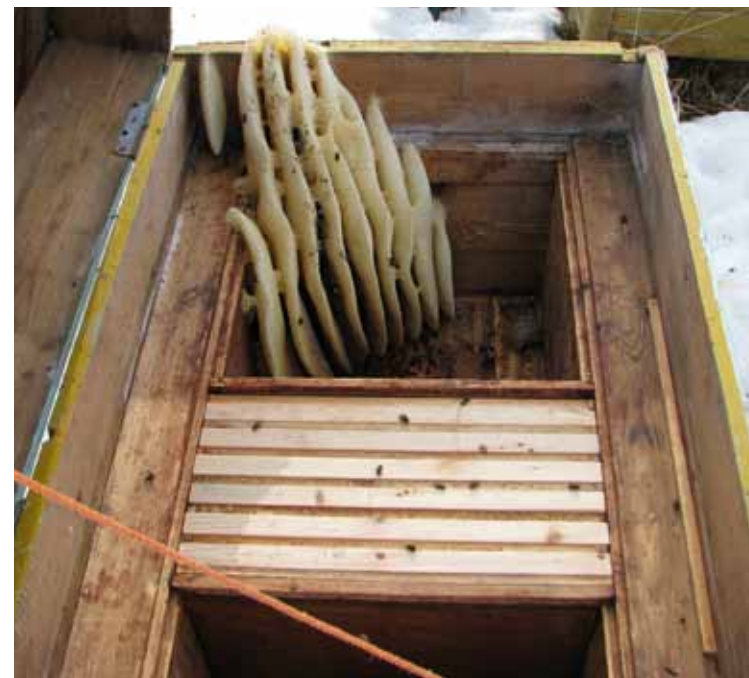
Sülemi poolt vabalt ehitatud kärjed ja etteantud elukeskkond

vaha asendamatu tooraine kärjepõhjade valmistamiseks. Mesilase elukeskkond on kärgede vahel. Mesiniku poolt etteantavad kärjepõhjad suunavad instinktiivse putuka järgima mesiniku tahet, võimaldades mesindamist süstematiseerida: kasutades kindlaid taru- ja raamitüüpe ning mee väljavurritamise tehnikat, sh. vurritusliine ning kärgede säilitamist ja ladustamist.