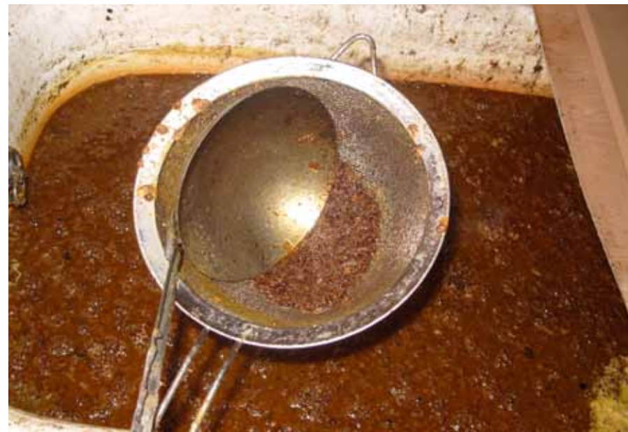
Nukukestade väljasõelumine vaha sulatamisel vees

Mitmekordse sulatamisega saab vaha puhtamaks, sest iga korraga saab võõrkehi eemaldada ja seetõttu jääb neid vahas vähemaks.