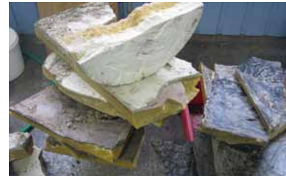
Mesiniku poolt sulatatud suure ballastaine sisaldusega vahaketas ja selituse läbinud vahaplaadid (neljakandilised)