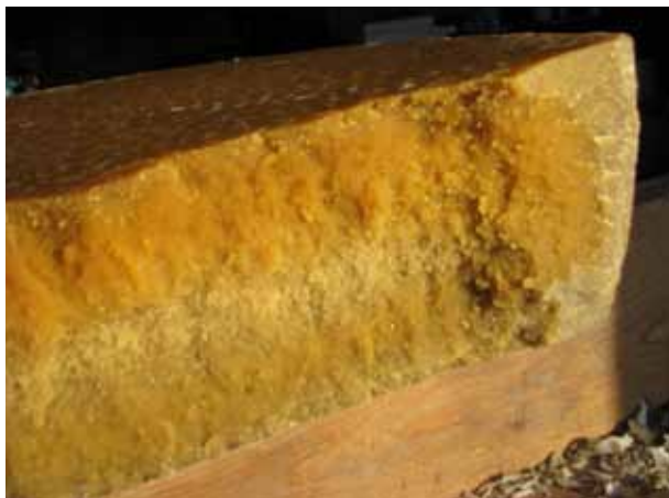
Suure veesisaldusega vahaketas