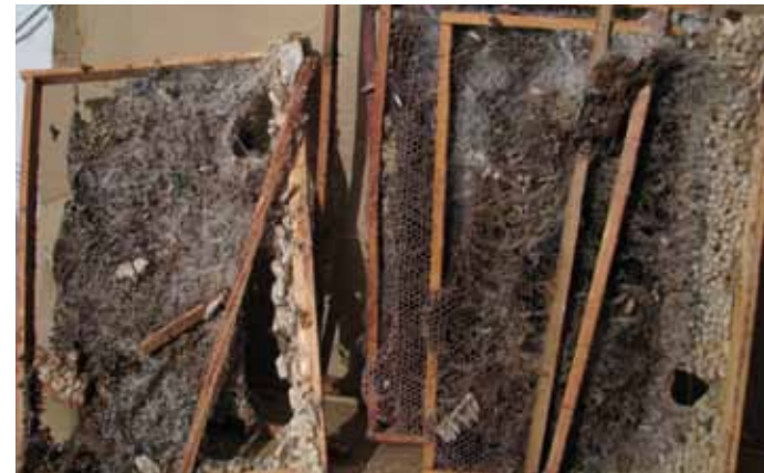
Kärjekoi poolt hävitatud kärjed

Röövikustaadiumile järgneb nukustaadium. Nukud on heledad kookonid ning paigutunud raami ja taru puiduosadele ja kohati ka “sööbinud” poolenisti puidu sisse. Nukke võib näha ka lamavtarus