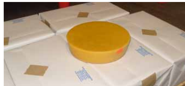
Pakitud kärjepõhi ja vahaketas

Kokkuvõtteks. Selleks, et kiirel hooajal ei tekiks kärjepuudust, siis, lugupeetud mesinikud, hoidke vaha- ja kärjemajandus korras, sulatage vanad kärjed esimesel võimalusel vahaks ning vahetage kärjepõhja vastu enne mesindushooaja algust.