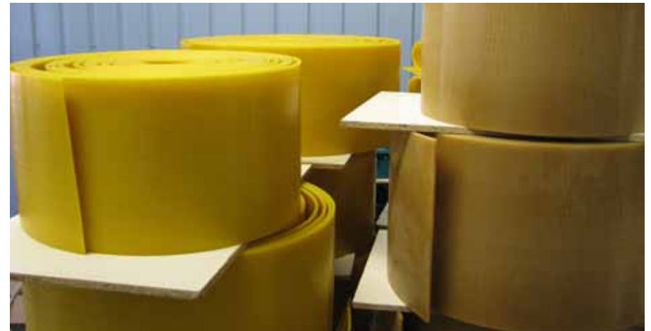
Vahalindid, erinevate partiide vahast. Tumedamast lindist selitatakse jääkained veel kord välja

maks vahalindi kokkukleepumist. Sellega on ette valmistatud õhuke ja sile vahalint, mis pannakse eraldiseisvasse gravüürvaltsimise masinasse.