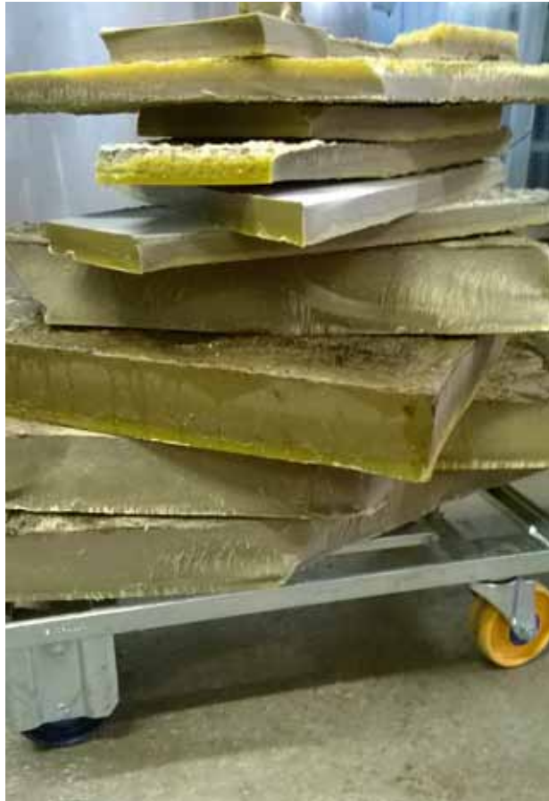
Selituse käigus eraldunud ballastaine

Vahakettad sulatatakse selitusvannis vedelaks vahaks. Vanni põhjas on veekiht, millesse settivad pikaajalise selituse käigus esmasel käitlemisel vahasse jäänud peenosakesed. Eraldi kihina settivad ballastained (parafiin, steariin jt.), mis on inimese poolt mingil etapil vahasse lisatud.