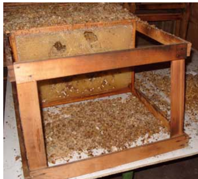
Hiirte poolt kahjustatud kärjed

Kärjehoidlates säilitatakse kärge kindlates kappides või kastides ja kasutatakse hiirte tõrjeks pidevalt üldlevinud vahendeid, nagu hiirelõks ja mürk. Kui kärge säilitatakse lahtistel riulitel, on hiirte tekitatud kahjustusi praktiliselt võimatu ära hoida.