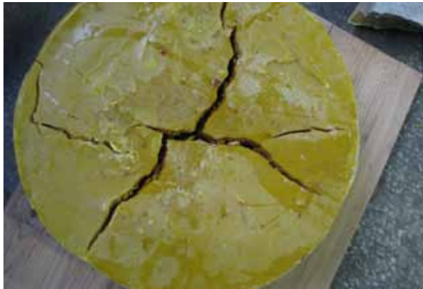
Kiiresti hangunud ja suure meesisaldusega vahaketas

Kärjemeistrile tuuakse erineva puhtusastmega vahakettaid.