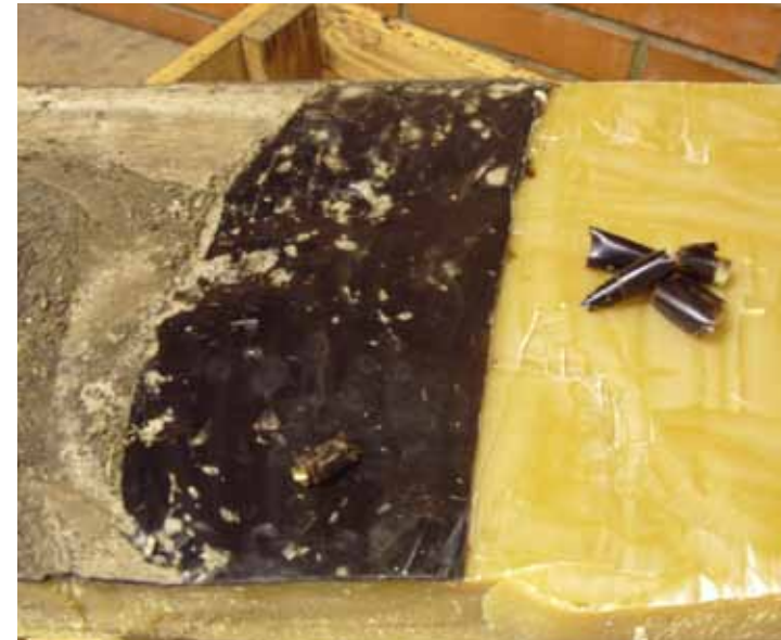
Selitusvannis välja settinud kõrbenud suira- ja meesosakesed (must kiht), nukukestad ja muu bioloogiline peenfraktsioon (hall osa)

Paaril viimasel aastal on Eestis kasvanud mesinike hulk, kes kasutavad ballastaineid sisaldavat vaha.