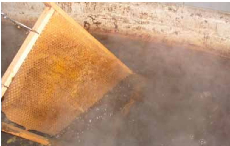
Kärje sulatamine vees

Vette sulatusega jäävad raamid puhtamad ja vaha kaoprotsent vaharabas väheneb. Kärjed koos raamidega uputatakse ca 90-kraadisesse vette. Vaha koos nukukestadega tõuseb vee peale ja ei imbu raamiliistude (puidu) sisse. Vee pealt korjatakse vaha ja nukukestad kulbiga kokku, sõelutakse või pressitakse vahapressiga.