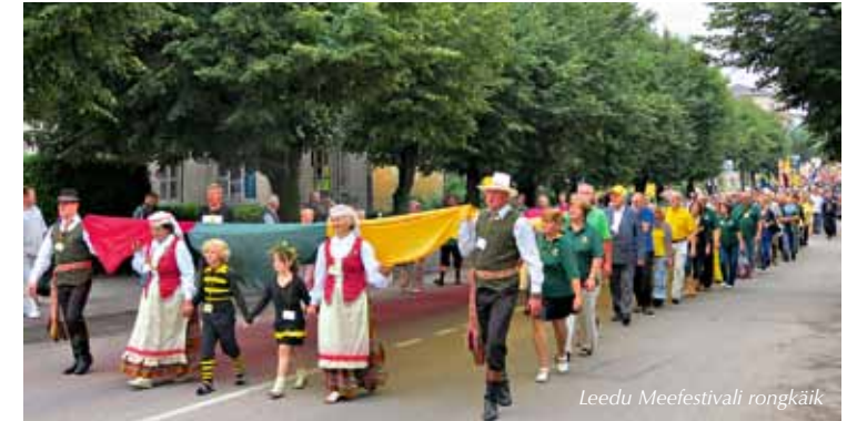
Leedu Meefestivali rongkäik

3.-5. augustini toimus traditsiooniline Leedu Meefestival, kus osales ka EMLi 43-liikmeline