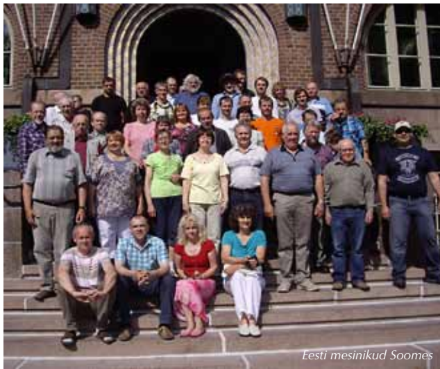
Eesti mesinikud Soomes

Ma usun, et mesinikud tegelevad ka aiandusega. Need, kel ei olnud võimalust erinevatel põhjustel osaleda meie mesindusalastel õppereisidel või ka ühineda Ungari reisiga, saavad tulla koostööprojekti raames Läti ja Leetu. Täpsem reisikirjeldus meie kodulehel www.mesinikeliit.ee