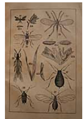
A.M. Butlerovi “Käsiraamat. Kuidas mesilasi pidada”