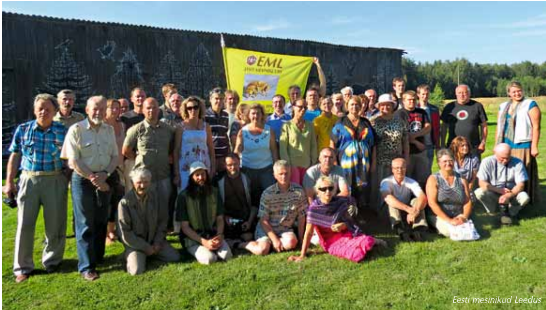
Eesti mesinikud Leedus