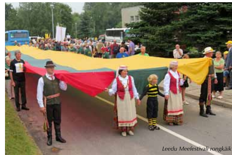
Leedu Meefestivali rongkäik

Head reiseid sünnivad alati vaid koostöös. Ootan teiepoolset infot ja soove, kuhu ja millal sooviksite koolitusreise. Kui