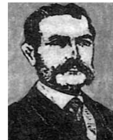
Francesco de Hruschka

Ka Eesti mesinduses hakkasid puhuma uued tuuled 18. sajandi lõpupoole, mil looduses hakkas nappima pakktarudeks sobilikke puutüvesid, mistõttu soovitati tarusid valmistada laudadest "nellikantlikud".