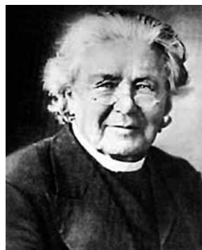
Lorenzo Lorrain Langstroth

mesilased ei täida taruvaiguga, ega ehita sinna ka kärge. Käigu suurus varieerub 5–9 millimeetri vahel. Üldreeglina on peaaegu kõik tarude konstrueerijad võtnud aluseks mesilaskäigu keskmise suuruse – 7 mm. Kui näiteks taru pesaruumi sein ja raami otsaliistu vahe on suurem kui 9 mm, siis ehitavad mesilased sinna kärje, aga kui see vahe on väiksem kui 5 mm, siis täidavad mesilased selle avause taruvaiguga. Seega oli Langstrothi avastus mesindusmaailmas epohhiloov ja teda tuleks pidada tõeliseks raamtaru leiutajaks, sest tema avastus võimaldas vabalt liikuvate raamidega taru konstrueerimise. Seda põhimõtet on agaralt kasutanud väga paljude maade mesinikud ja tarude konstrueerijad, mille tulemusena maailmas tuntakse tänapäeval üle 600 erineva tarutüübi.