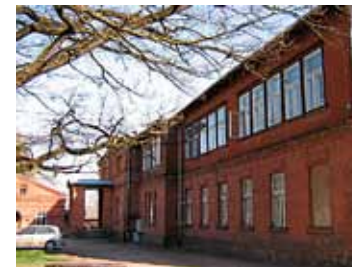
Viljandi Eesti Põllumeeste Seltsi kunagine hoone

noomituse alla ja ütles neile: “Teie, Juuru kihelkonna koolmeistrid, tahate siin ühte niisugust seltsi asutada, mis ei kõlba mitte teha. See põllumeeste selts on kui üks suur hall mantel, kuhu alla poete ja seal kurja nõu peate. Mina aga ütlen teile, Juuru koolmeistrid, kui teie tahate selles seltsis edaspidigi töötada, siis andke koolmeistri amet oma vendade kätte!”