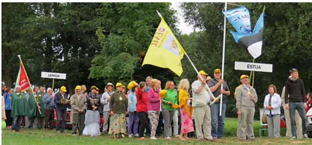
Rongkäigu ootel..