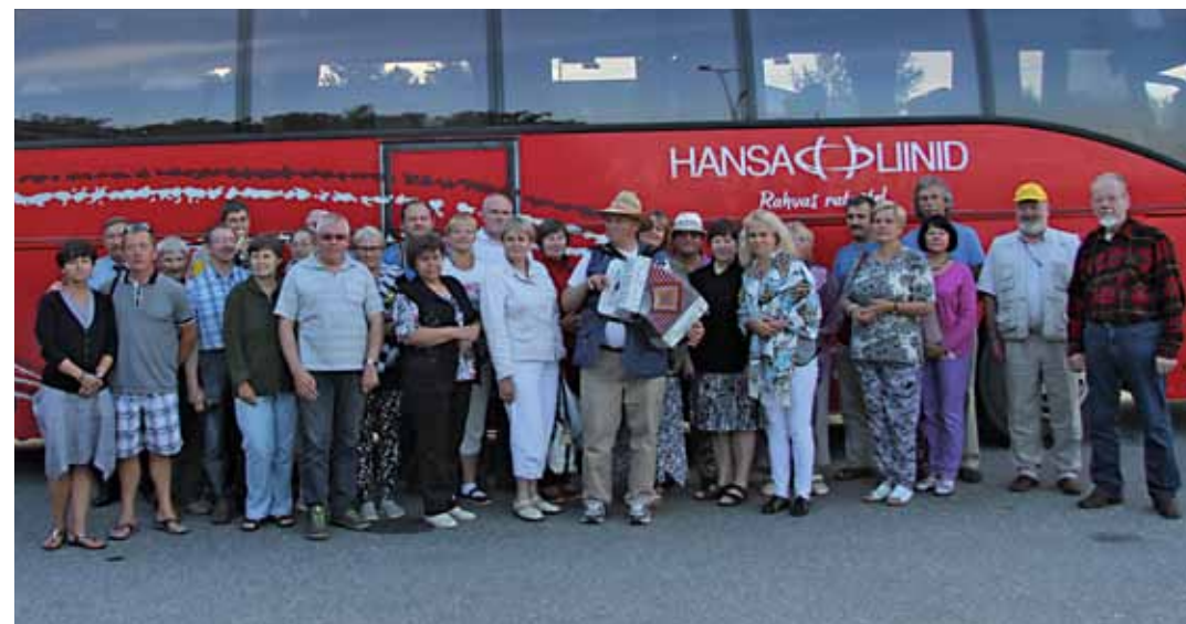
Traditsiooniline ühispilet.

Oli selle aasta juulikuus viimane varahommik, kui mõnus seltskond mesinikke üle Eestimaa jättis oma tööd ja tegemised sinnapaika ja häälestas end Leedu meefestivali laienele. Reis algas Tallinnast ja kulges läbi Jüri, Viljandi, Pärnu, Ikla, läbi Läti ja peaaegu läbi terve Leedu-Poola piiril asuva kena Leedu linna Alytuseni. Ette rutates ütlen, et reis oli väga tore ja ilm oli festivali ajal ka tip-top. Ainult esimesel päeval Viljandist välja sõites algas