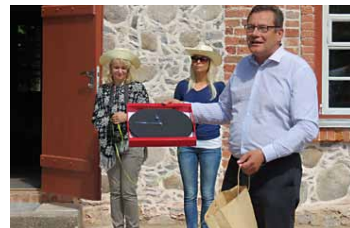
Meekoja lindi läbilõikamisel.

Marianne Rosenfeld mesilaspere@gmail.com 50 29 006