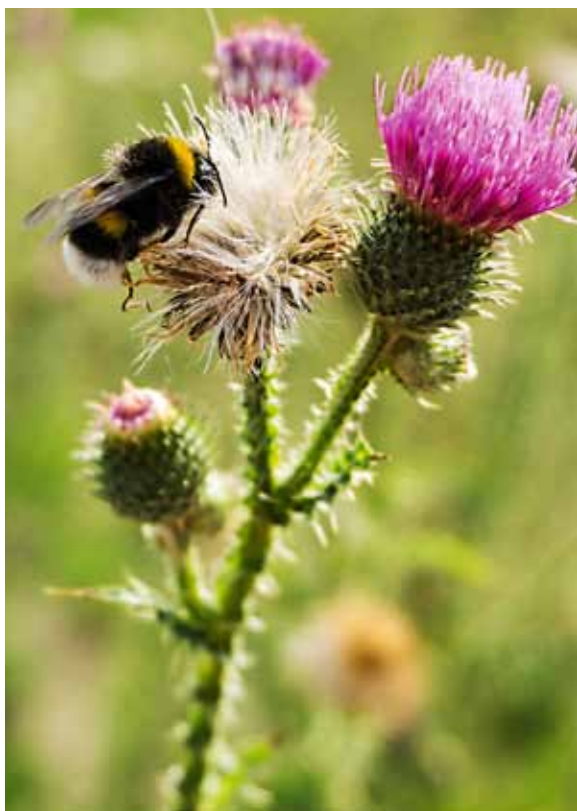
Kimalastel on mesilastest suurem soodumus saada neonicotinoidisõltlaseks.

Üllataval kombel tõmbavad mõned taimekaitsevahendid mesilasi lausa ligi. Inglise ja Iirimaa teadlased kirjutasid teadusajakirjas "Nature", et mesilased ei väldi sugugi neonicotinoididega töödeldud taimi, vaid paistavad neid hoopis teistele eelistavat. Sellepärast satub nektari- ja õietolmu-