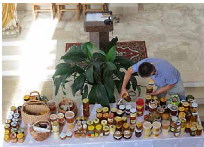
Kirikusse õnnistamiseks toodud mesi.