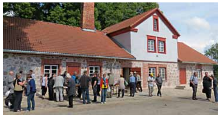
11. juulil 2015 avatud Olustvere Meekoda.

COLOSS kasutab andmete kogumiseks rahvusvaheliselt standardiseeritud meetodeid**, mis võimaldavad eri riikide andmeid ühtsetel alustel võrrelda ja analüüsida. Riskitegurite detailse analüüsi koostamisel võetakse aluseks nii kõnealuse küsimustiku tulemused kui ka teistest riikidest saadud mesilasperede suremust puudutavad andmed.